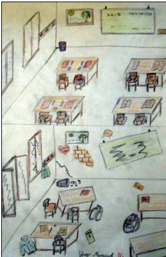
„Мислите о томе 1.део“ - Урош Милетић 4/1"