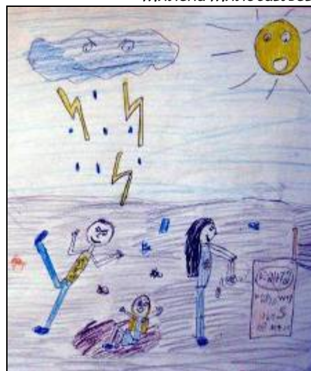
„Ал сте ви неке фаце“ - Миона Рацић 4/1