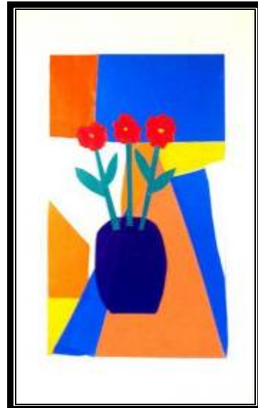
Јована Милићевић 4/5