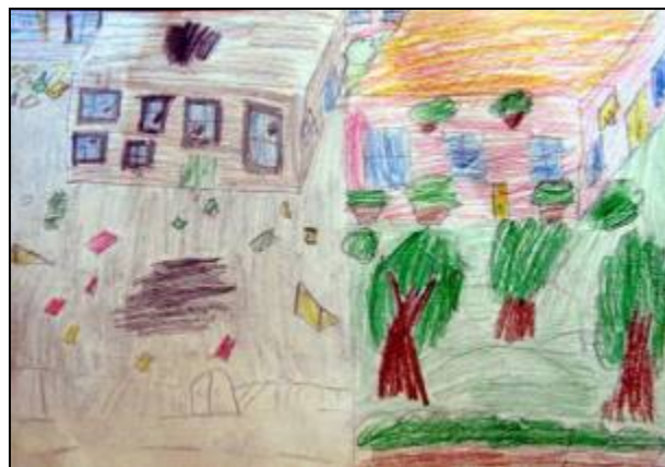
„Мислите о томе 2.део" - Јован Михајловић 4/1