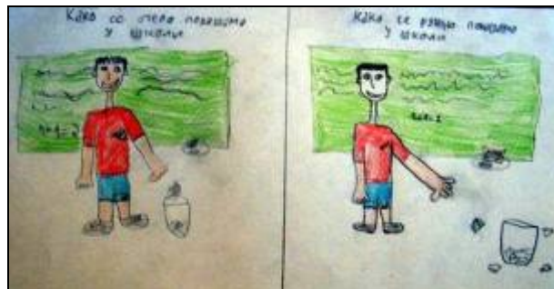
„Мислите о томе 3.део" - Никола Јовановић 4/1