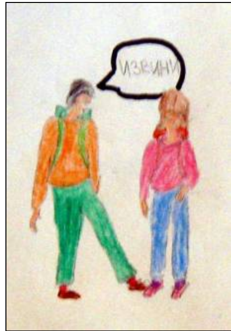
Неда Милосављевић 4-1