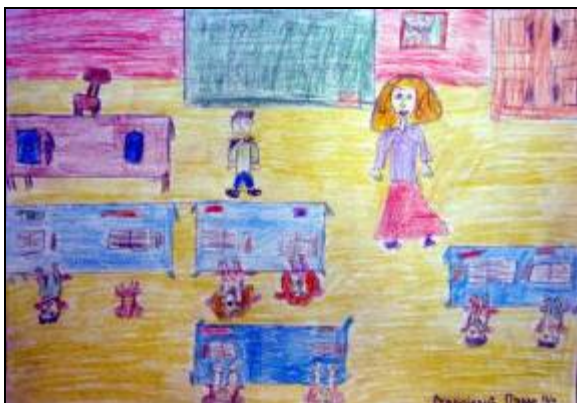
„Добро нам дошли прваци”-Станојевић Павле 4/1