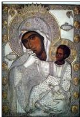
Чудотворна икона Пресвете Богородице Утешитељке