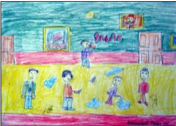
Павле Станојевић 4/1