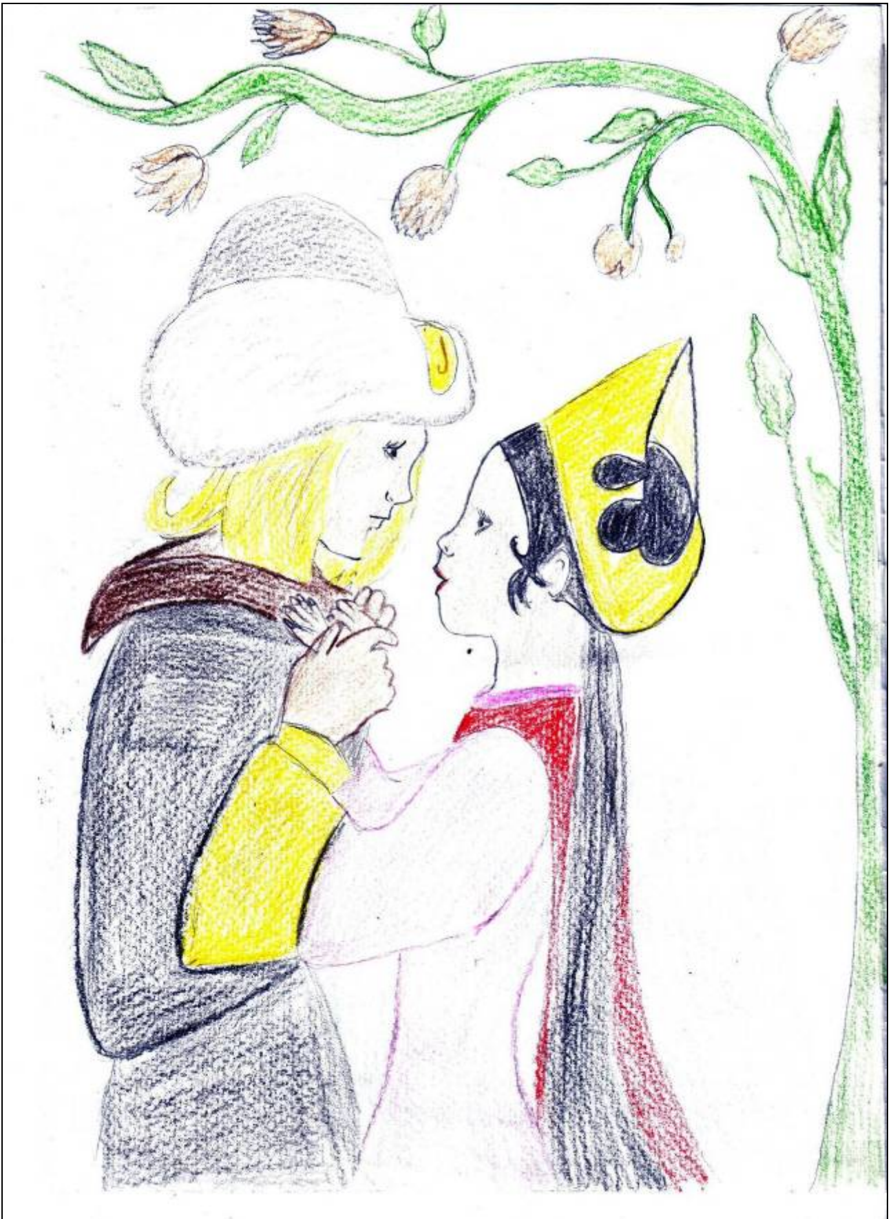
Јована Арсић 4/5